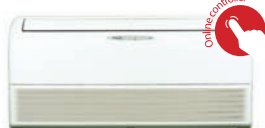
Flexi - FLXS-B